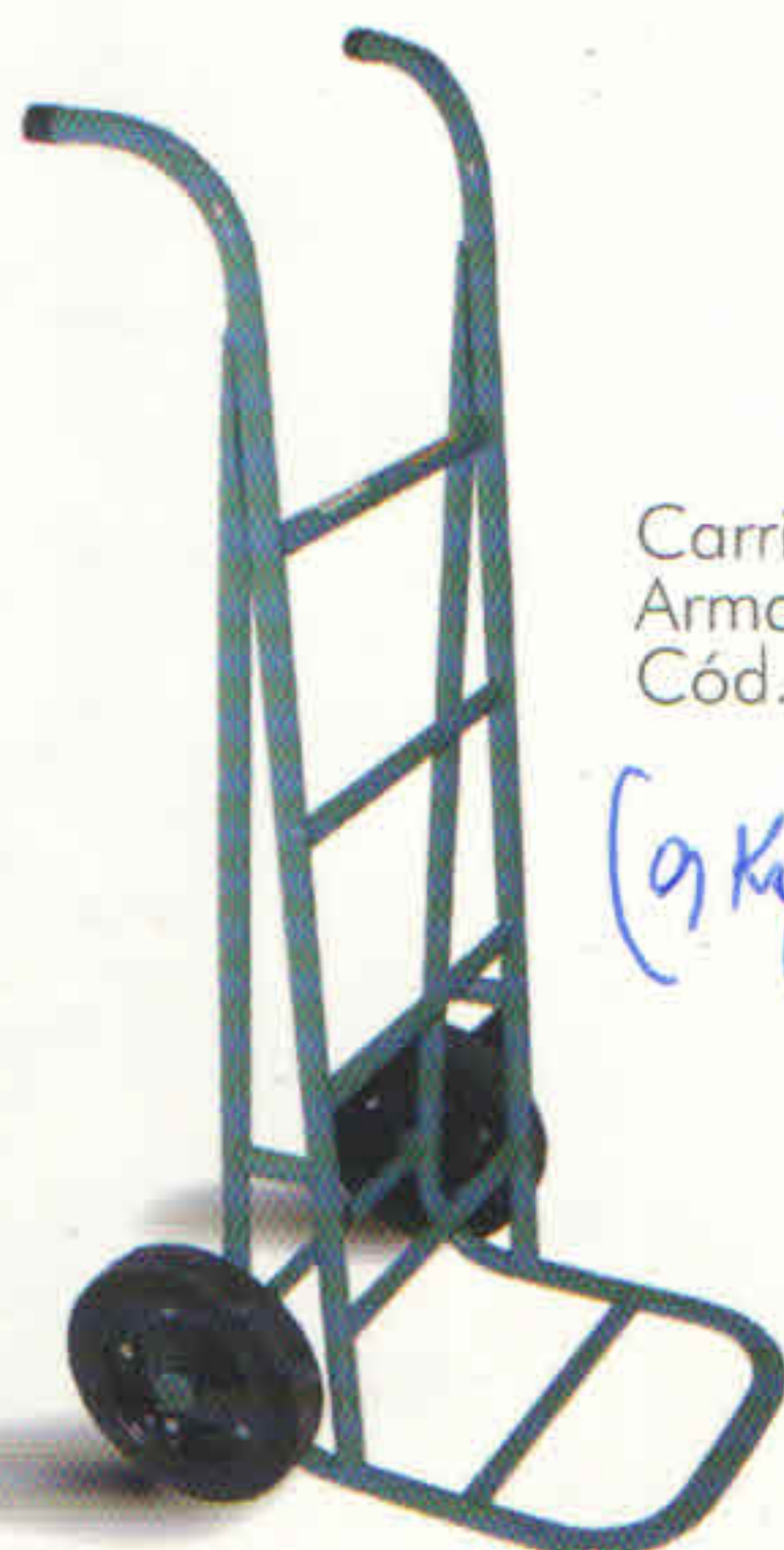
Carrinho mod. Armazém 120 kgs Cód. 01.0403