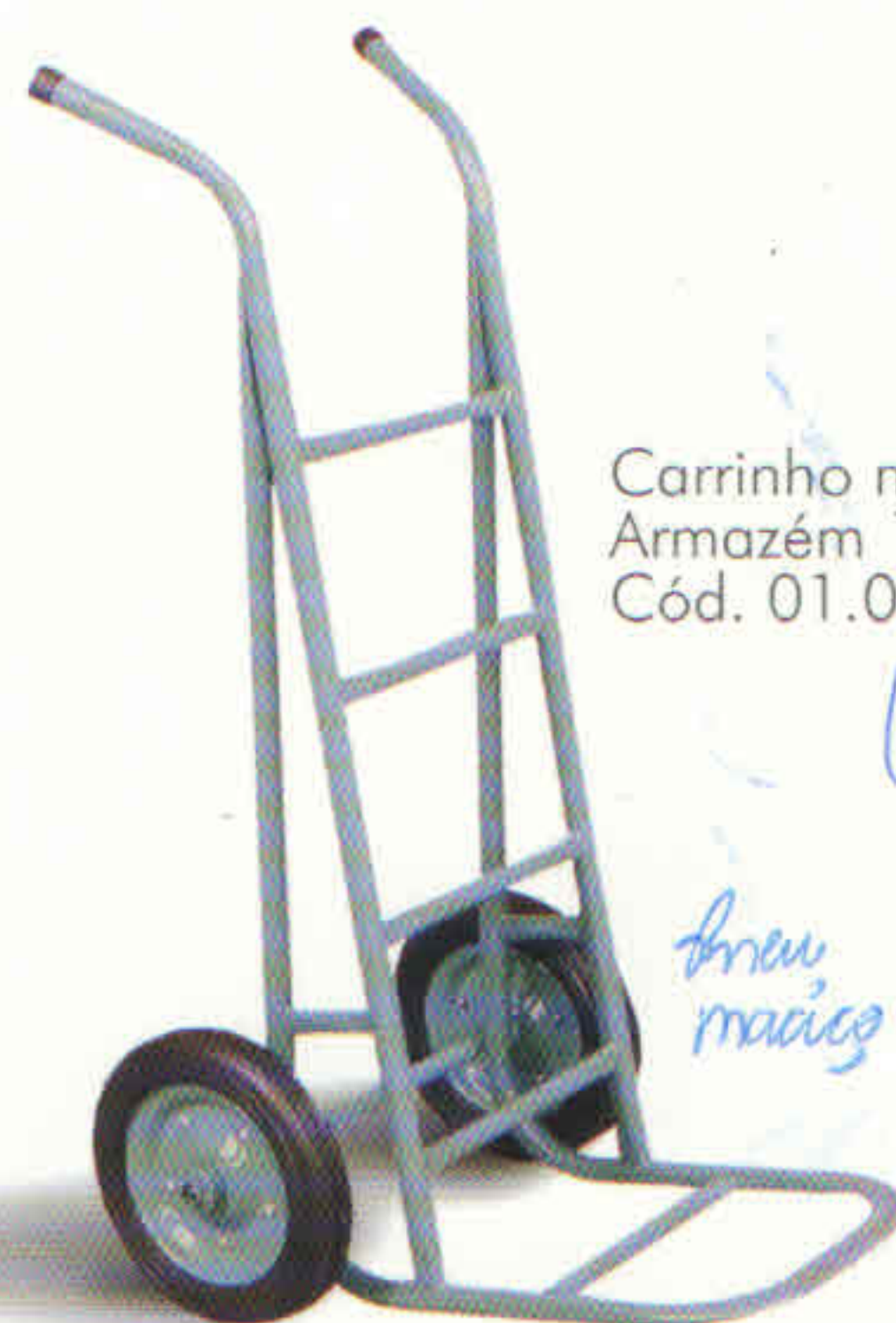
Carrinho mod. 180 Armazém 180 kgs Cód. 01.0413