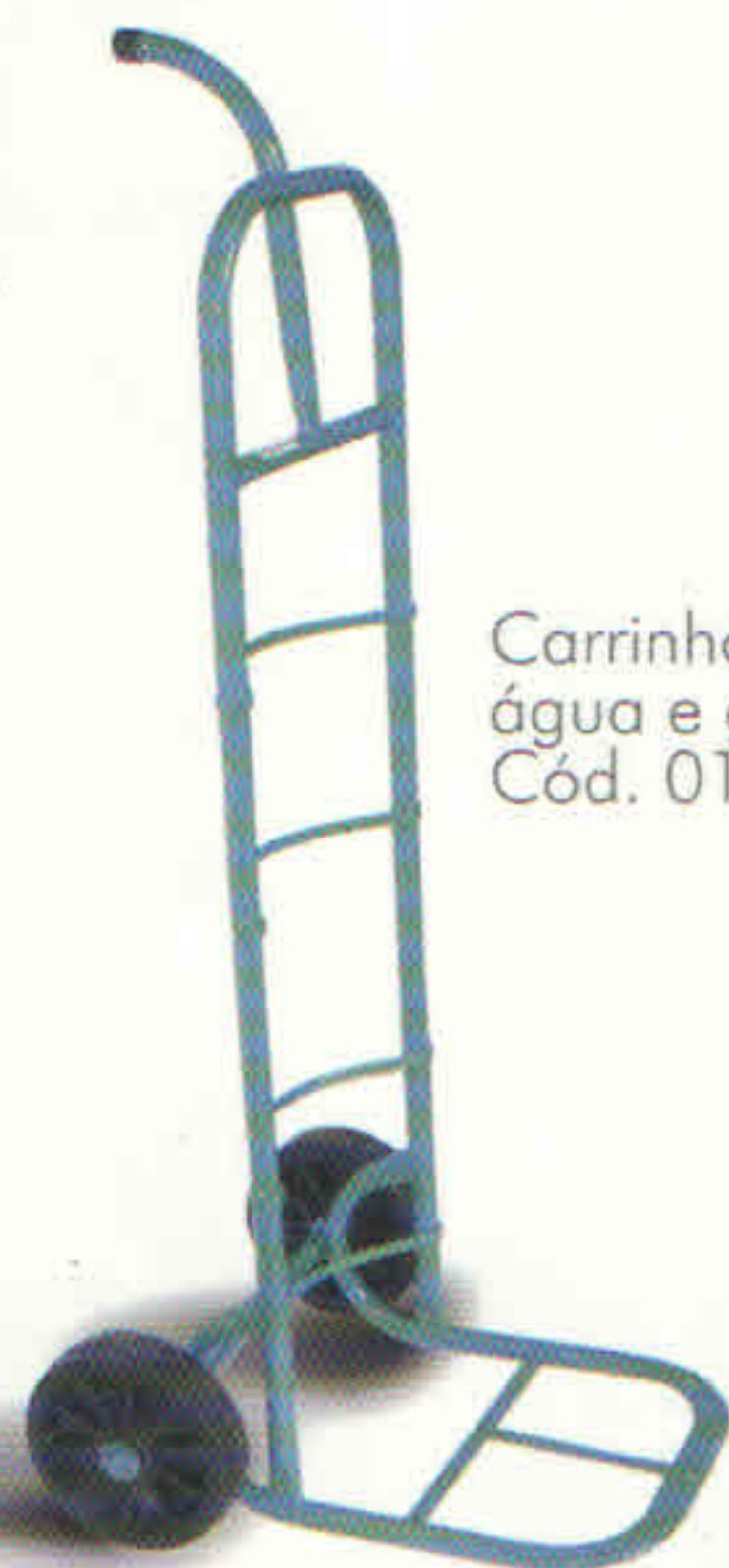
Carrinho mod. água e gás Cód. 01.0402