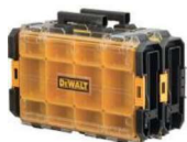
CAIXA ORGANIZADORA COM TAMPA TRANSLÚCIDA IP65 TOUGHSYSTEM®