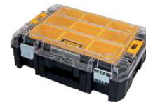
ORGANIZADOR COM TAMPA TRANSLÚCIDA TSTAK®