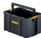
CAIXA PROFUNDA ABERTA - TIPO SACOLA TSTAK®