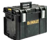
ORGANIZADOR EXTRA GRANDE TOUGHSYSTEM® DS400