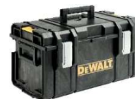
GRANDE ORGANIZADOR TOUGHSYSTEM®