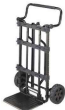
CARRO ORGANIZADOR TOUGHSYSTEM®