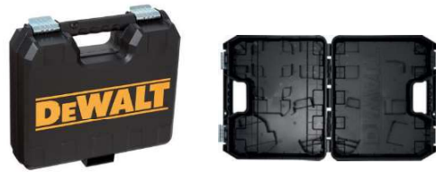
MALETA PARA FURADEIRA/MARTELETE