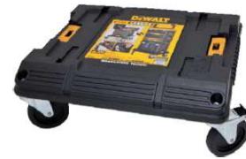
BASE COM RODAS TSTAK®