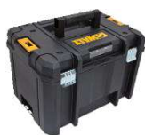
ORGANIZADOR TSTAK® NO. 2 COM FECHO METÁLICO