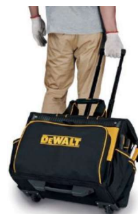
BOLSA DEWALT MULTITASK COM RODINHAS