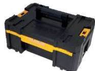
CAIXA COM GAVETA PROFUNDA TSTAK®