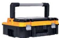
CAIXA TSTAK® COM ALÇA LONGA