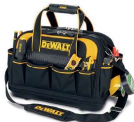
BOLSA DEWALT MULTITAREFA