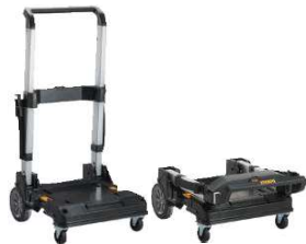
CARRO AJUSTÁVEL TSTAK®