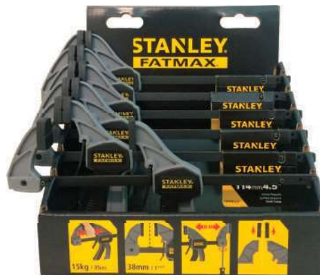
Grampos de 4.5" acompanham display (múltiplo de 6) Medidas: 19 alt x 17 larg x 11,5 prof (cm)